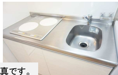
※モデルルーム仕様の写真です。